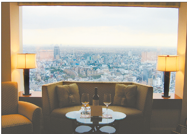
Apartament w hotelu Ritz w Tokio

Arystokraci, szekowie, prezesi największych firm na świecie i gwiazdy show-biznesu z pierwszych stron gazet mogą wkrótce częściej gościć nad Wisłą.